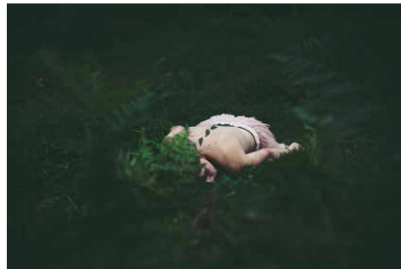
Ana Šantl, Safe Grounds, fotografija, 30x40 cm, 2013.