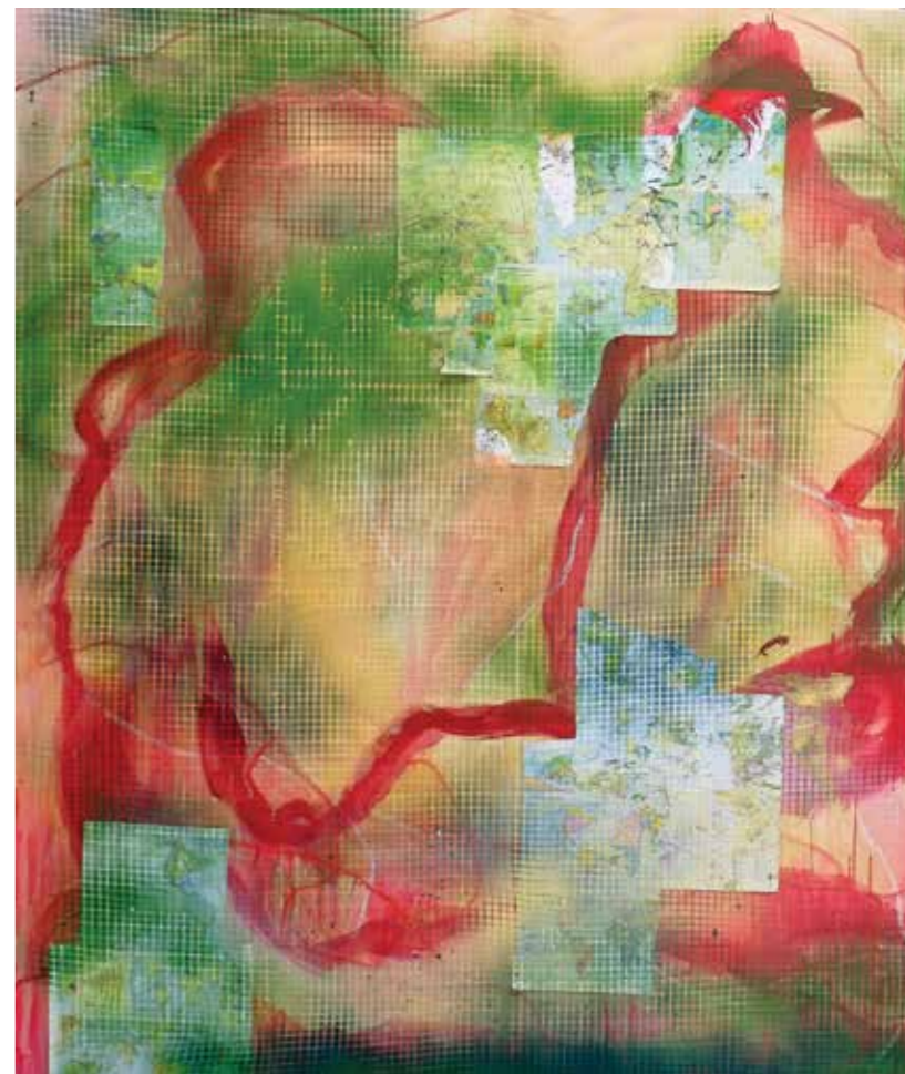
Maša Gala, Mapping 3, mešana tehnika, 140x160 cm, 2013, foto: Staš Hrenič.