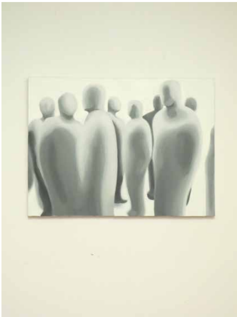
Silvia Plavša, Tih dialog, akril na platnu, 62x83 cm, 2010.