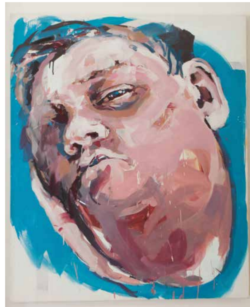
Blanka Bračić Topolšek, Minljivost, akril in šivanje na platnu, 60x70 cm, 2006.