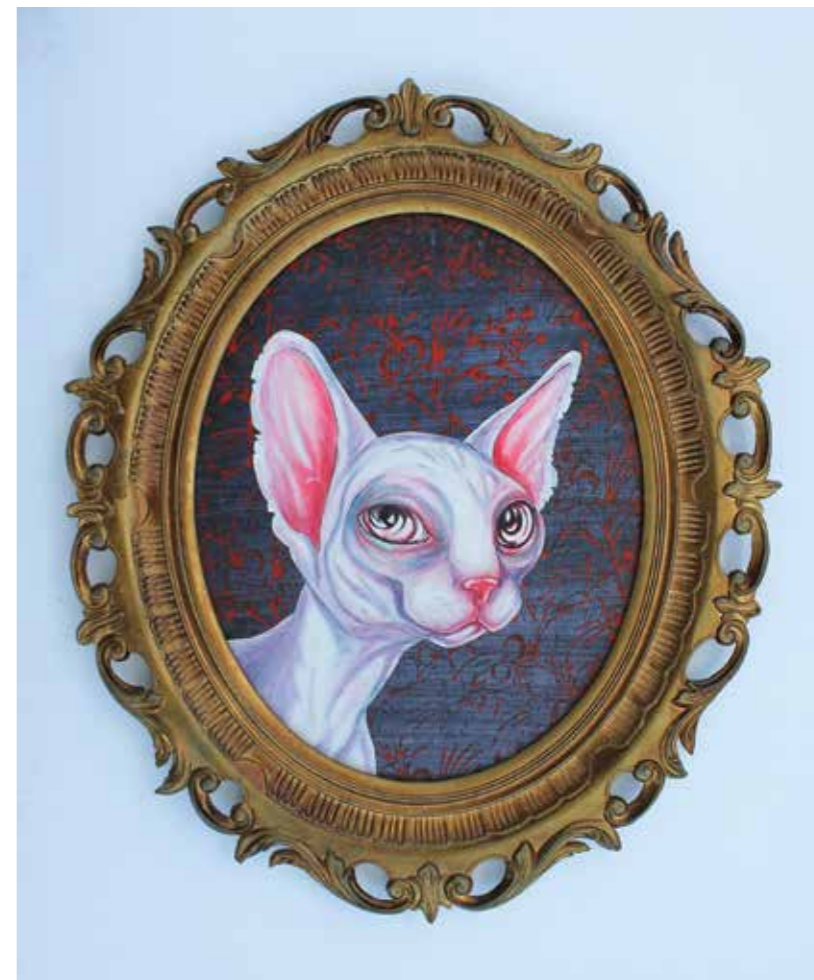
Barbara Jurkovšek, Imperator, olje in akril na kartoniranem platnu, 66x56 cm, 201.