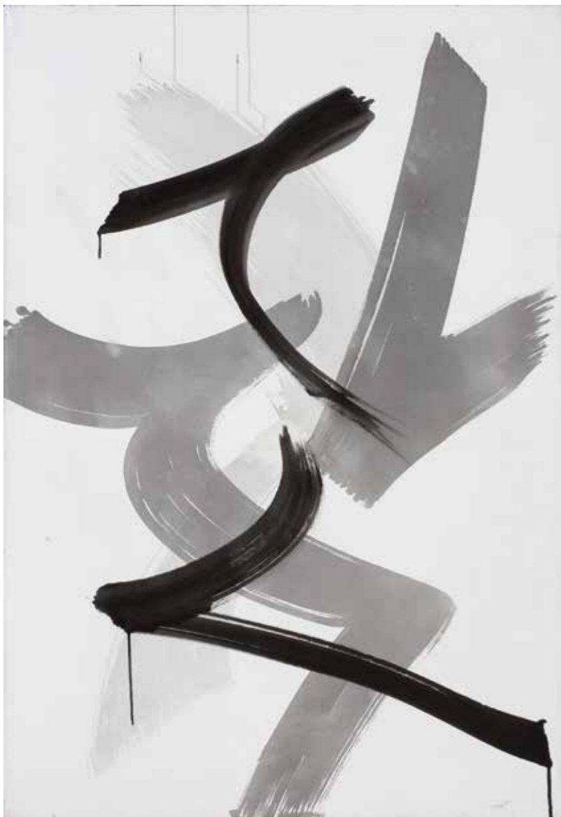
Peter Gaber, Sistem formaliziranih gest, akril na platnu, 160x110 cm, 2006.