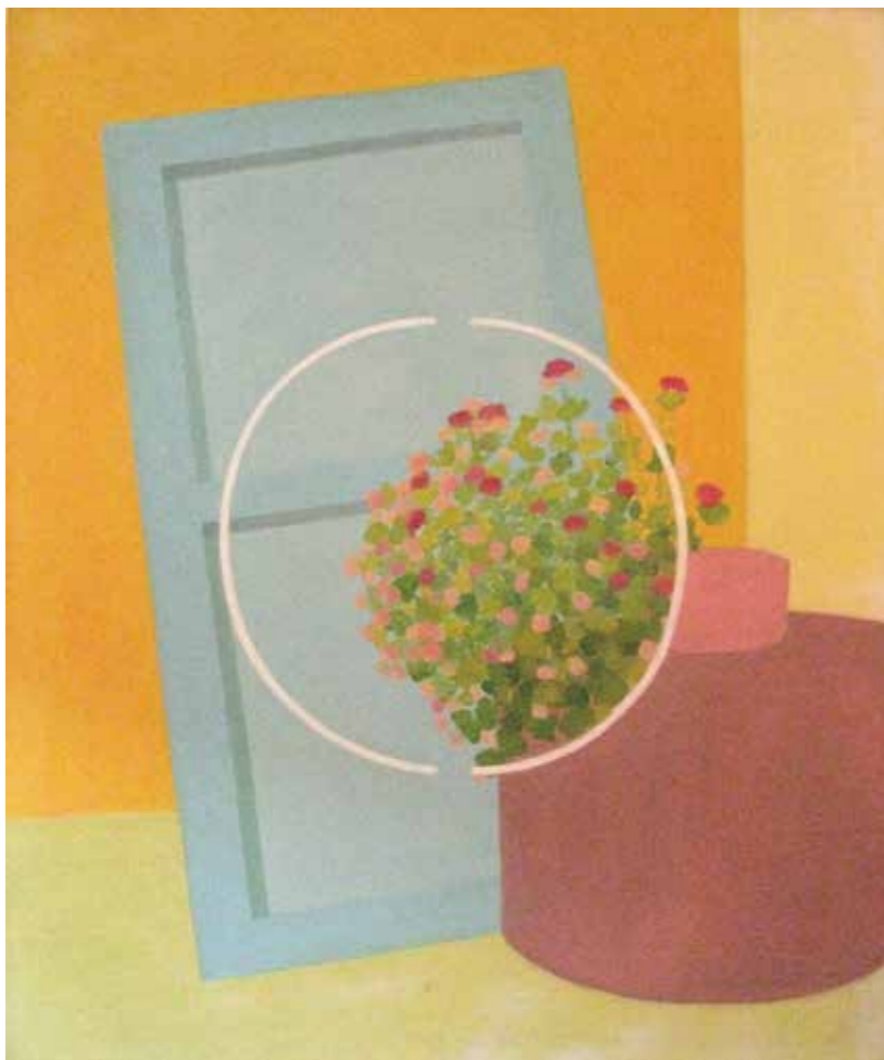
Karmen Bajec, Pričetek poletja , olje na platnu, 79x95 cm, 2011.