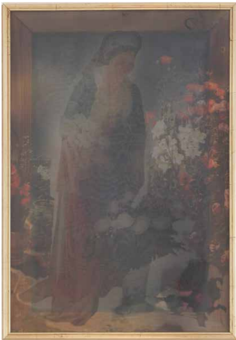
Katja SUDEC, V Sarinem vrtu I (po Johnu Fredericku Lewisu) tisk na prosojnem materialu, epoksi smola, umetne rože, 50x70 cm, 2013.