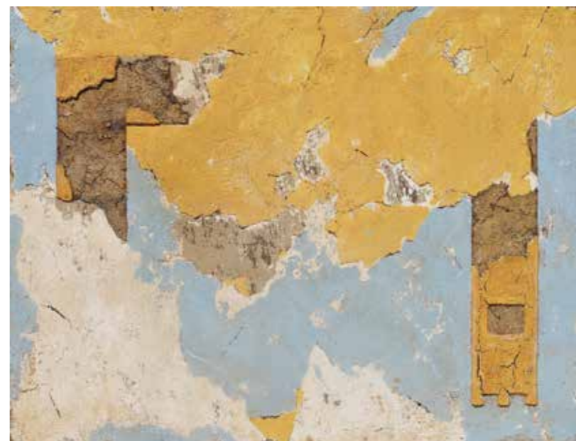
Dubravko Baumgartner, Panonski zid , mešana tehnika na platnu, 90x120 cm, 2011.