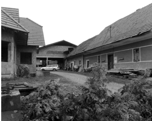
Slika 2, Slika 3: Osrednji del naselja Dobrovce, ki ga označujejo velike kmečke hiše, številna gospodarska poslopja in hlevi (slemena hiš potekajo pravokotno na prometnico).