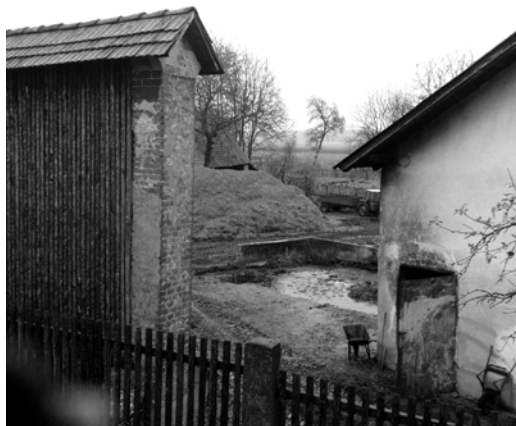
Slika 4, Slika 5: Vodovarstveno območje na vzhodnem robu naselja Dobrovce, gnojišče na robu vodovarstvenega območja.