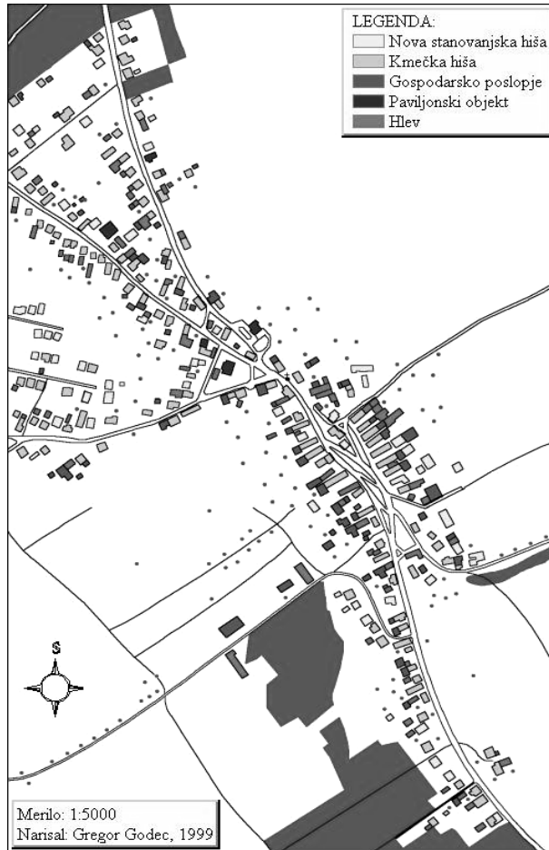
Slika 6: Vrsta stavb v naselju Dobrovce.