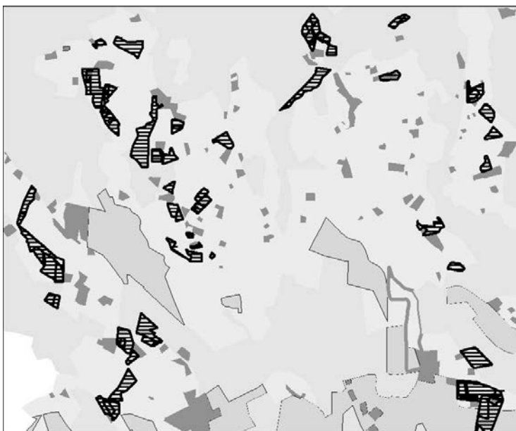
Slika 2: Prikaz pobud (zemljišč, prikazanih s črno vodoravno šrafuro) za spremembo namenske rabe prostora v stavbno zemljišče v eni od občin severovzhodne Slovenije.