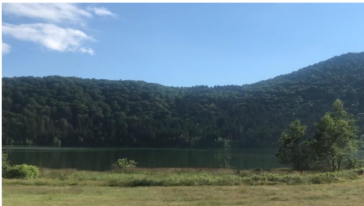
Jezero sv. Ana, regija Harghita, Romunija

Namen trajnostnih oblik turizma je učinkovito gospodarjenje z naravnimi viri, spoštovanje lokalnih skupnosti in razvoj dolgoročne poštene gospodarske dejavnosti. Da bi prispevali majhen del k temu velikemu prehodu na trajnost, partnerji iz šestih držav poskušajo razviti dragocena orodja v okviru projekta BLUE TOURISM, o katerem lahko preberete v naši 1. številki.