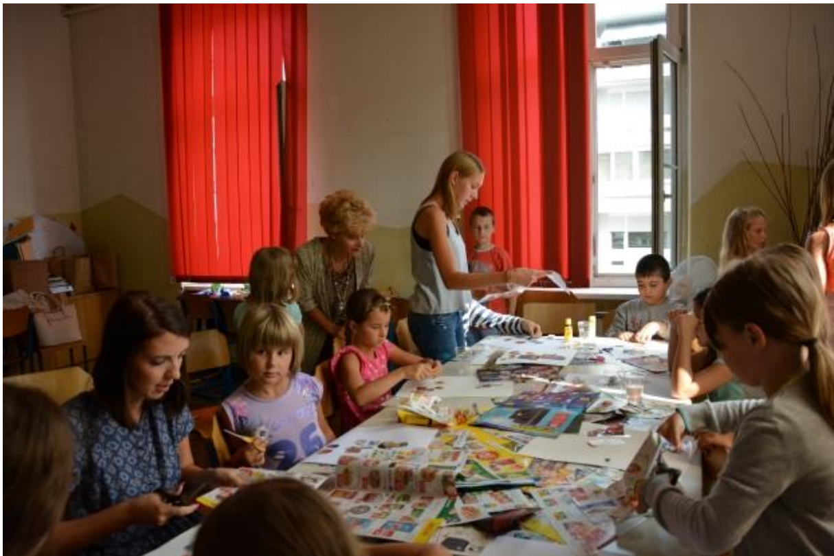
Delavnice združujejo otroke različnih starosti in narodnosti