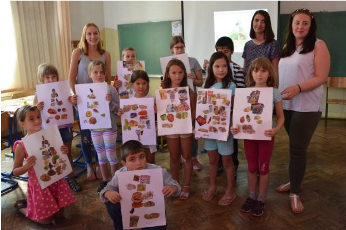
Z izvrstnimi izdelki se je bilo treba seveda tudi poslikati